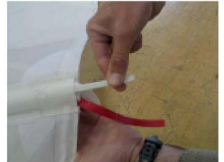
Engager la sangle dans le gousset par dessus la latte en maintenant la garcette à l'extérieur.

Pousser à fond afin de mettre la latte en tension.