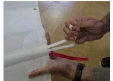
Glisser le chausse latte sur le dessus de la sangle en maintenant la garcette à l'extérieur du gousset.

Agiter le chausse latte de droite à gauche afin de décrocher le velcro.