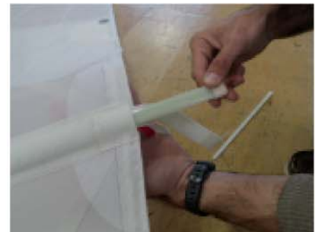
Retirer le chausse latte et la sangle en même temps. Vous pouvez retirer la latte.

En cas de difficultés n'hésitez pas à contacter votre agence Starvoiles