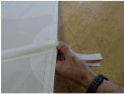
Engager la latte par l'arrière du gousset jusqu'à la butée.